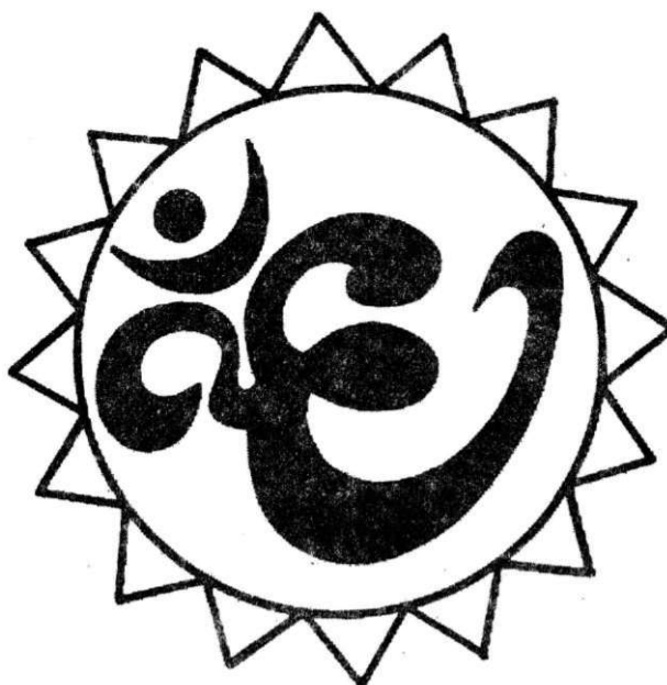
Рисунок для фиксации глаз

Вариант 3. Вокруг знака проведена окружность. Перемещайте свой взгляд по окружности, двигая одновременно глаза и голову. Делайте упражнение вначале с открытыми глазами, затем с закрытыми, представляя окружность.